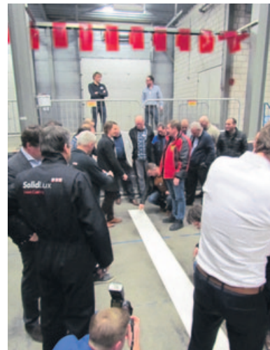
De aanwezigen hadden behoefte om de coating nog even te bevoelen